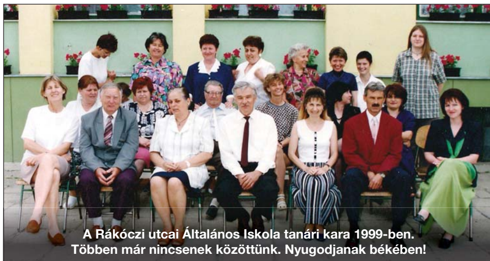
A Rákóczi utcai Általános Iskola tanári kara 1999-ben. Többen már nincsenek közöttünk. Nyugodjanak békében!