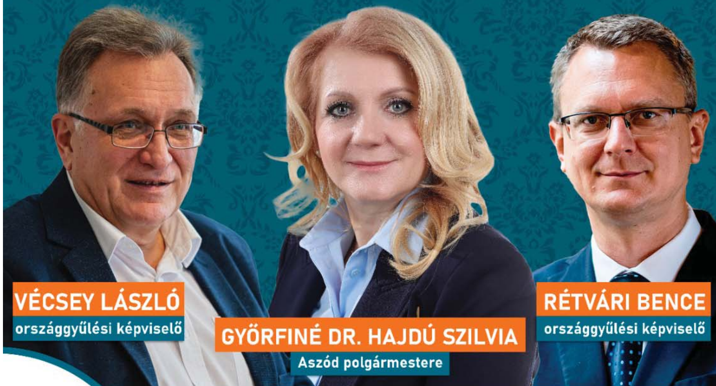
VÉCSEY LÁSZLÓ országgyűlési képviselő