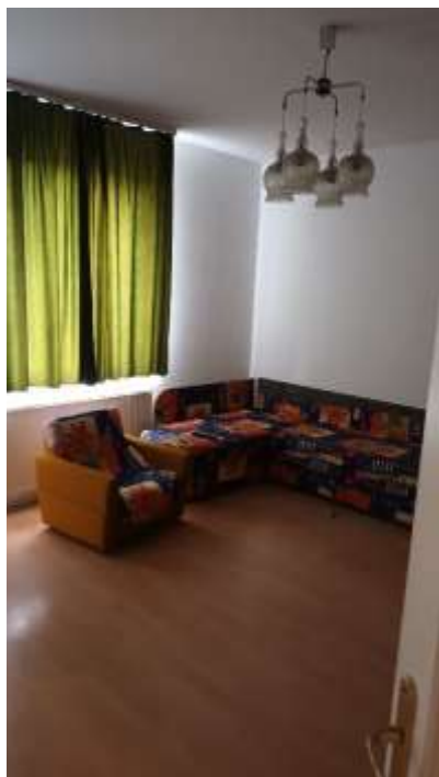
Aszód, Falujárók útja 30.