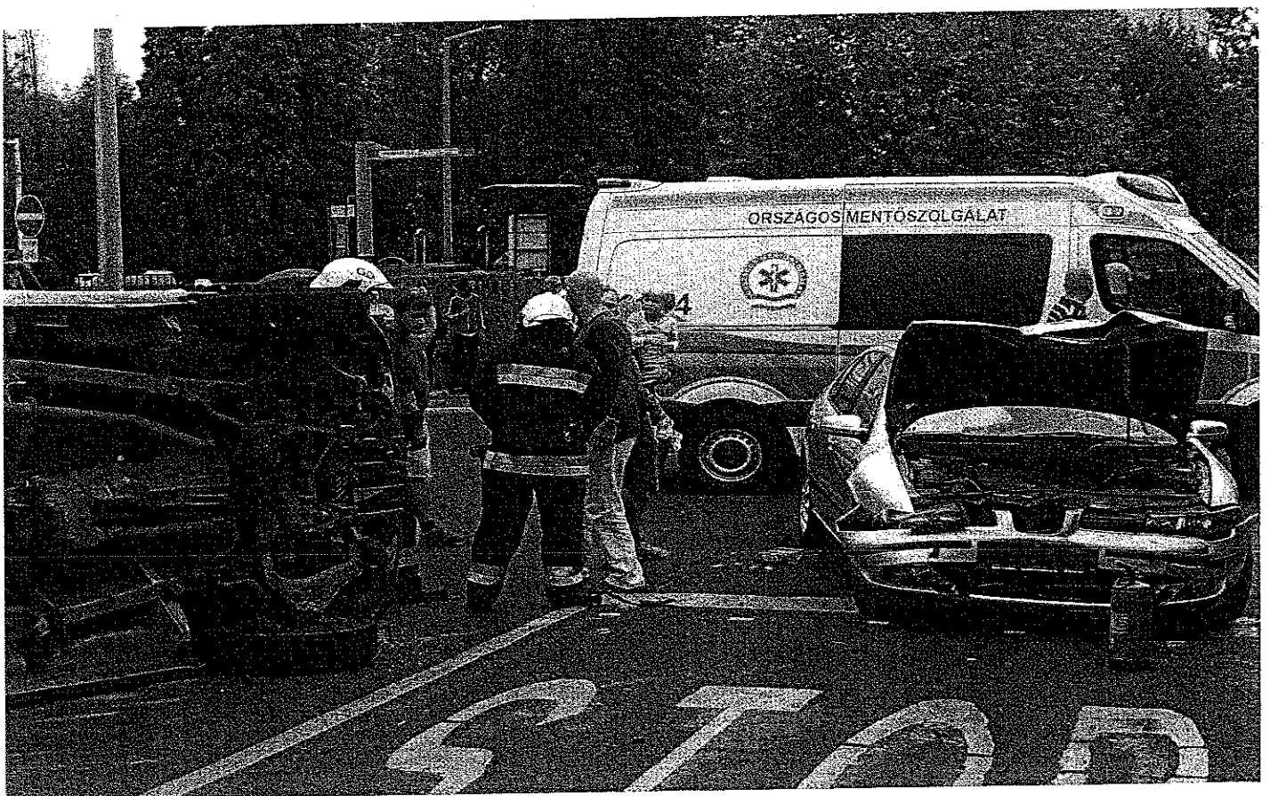
Lent: Műszaki mentés