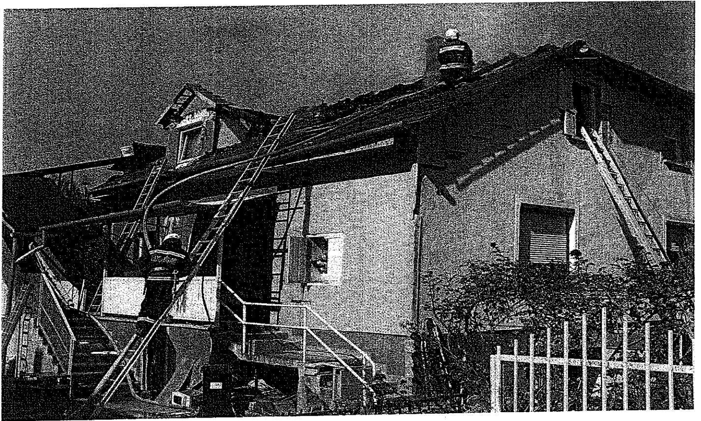
Fent: Lakóház tűz