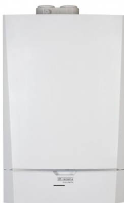
1. ábra "C" típusú gázkészülék

beépíteni. Hatványozottan igaz ez a modernebb vagy felújított, fokozott légzárású nyílászárókkal ellátott épületekre, ahol ezek hiányában a CO feldúsulása csak idő kérdése. Jelentősen felgyorsítja a folyamatot, ha a gázkészülékkel egy légtérben valamilyen elszívó berendezést, vagy kandallót, cserépkályhát üzemeltetnek, mivel a kiszívott levegő helyére - szükségszerűen - az egyetlen maradék szabad nyíláson, a kéményen keresztül áramlik levegő, de ez viszont a füstgázzal ellentétes irányú, és a gázkészülék tökéletlen működését okozza. A szakértői vizsgálat egyértelműen kimutatta, hogy a hagyományos (gravitációs) kéményben megvalósuló füstgáz kiáramlás a konyhai elszívó berendezés bekapcsolásakor megfordul és a helyiség felé áramlik vissza. Sajnos a készülék visszaáramlás érzékelője nem erre az esetre készült, termikus elven működik, a forró füstgáz visszatorlódásakor létrejövő hőmérséklet emelkedést érzékeli, a hideg, külső levegővel keveredett füstgáz esetében hatástalan volt. „C” típusú (égési levegő hozzavezetéssel és égéstermék-elvezetéssel rendelkező) készülékek (pl. ún. „turbós” készülékek, kondenzációs kazánok) az égéshez szükséges levegőt a szabadból szívják, oda vezetik - ventilátorral - a füstgázt is. Az égéstermék a helyiségtől gáztömören lezárt, nem fordulhat elő CO mérgezés.