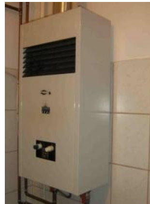
2. ábra "B" típusú gázkészülék

Ebben a kérdésben különösen veszélyes a pontatlan tudás, ami hamis biztonságérzetet teremt! Az utóbbi évtizedben terjedtek el a modernebb, piezo-elektromos gyújtású fűtőkészülékek és vízmelegítők, melyek zárt készülékházzal készülnek , nem látni már sem őrlángot, sem a főégőt. De ettől még nem lesz a gázkészülék zárt égésterű! Alapvetően három gázkészülék-típust különböztetünk meg. Az égéstermékek eltávolítását és az égési levegő biztosítását „A” típusú (égési levegő hozzavezetés és égéstermék-elvezetés nélküli) készülékek esetében, (pl. gáztűzhely, gázbojler, hőszugárzó) a helyiség megfelelő szellőztetésével kell(ene) megoldani. A „B” típusú (égési levegő hozzavezetés nélküli de égéstermék-elvezetéssel rendelkező) készülékek, (pl. a legtöbb fűtőkészülék és vízmelegítő, valamint a kéményes konvektorok), az égéshez a helyiség levegőjét használják, a füst a kéményen keresztül távozik. A kéményben viszont csak akkor alakul ki megfelelő áramlás, ha az égéshez felhasznált levegő (távozó füstgáz) helyére friss levegő áramlik a helyiségbe. Mivel a fűtőkészülékek üzeme állandó a légpótlás időszakos szellőztetéssel nehezen biztosítható. Öreg épületek rossz légzárású nyílászárói, egyéb szellőzőkürtők esetlegesen megoldhatják a problémát, azonban a megfelelő működés érdekében erre a célra kifejlesztett légbevezető nyílásokat javasolt