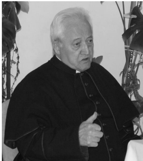
Juhász Gyula Consolatio

Nem múlnak ők el, kik szívünkben élnek, Hiába szállnak árnyak, álmok, évek. Ők itt maradnak bennünk csöndesen még, Hiszen hazánk nekünk a végtelenség.