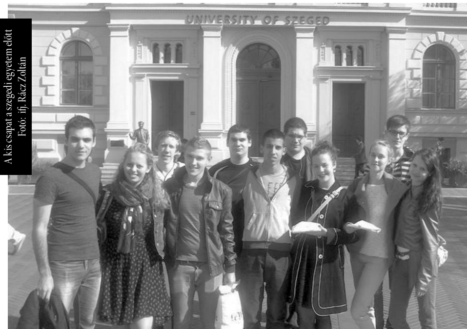
A kis csapat a szegedi egyetem előtt

Iskolánk még nyáron meghívást kapott egy a francia kultúrával és az európai unióval foglalkozó, két napos akadályversenyre. A szegedi egyetem egy 12 fős csapatot invitált a végzős osztályból, aminek mi nagy örömmel tettünk eleget.