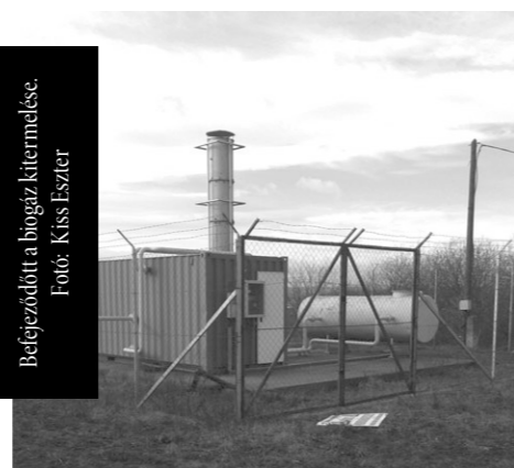
Befejeződött a biogáz kitermelése.