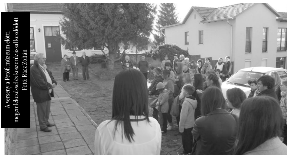
A verseny a Petőfi múzeum előtti megemlékezéssel és koszorúzással kezdődött

Harmincyolcadik alkalommal került megrendezésre Aszódon a körzeti Petőfi Szavalóverseny, amelyre több, mint 40 diák nevezett. A megmérettetés hagyománytisztelő módon a Petőfi Múzeum előtt megemlékezéssel kezdődött.