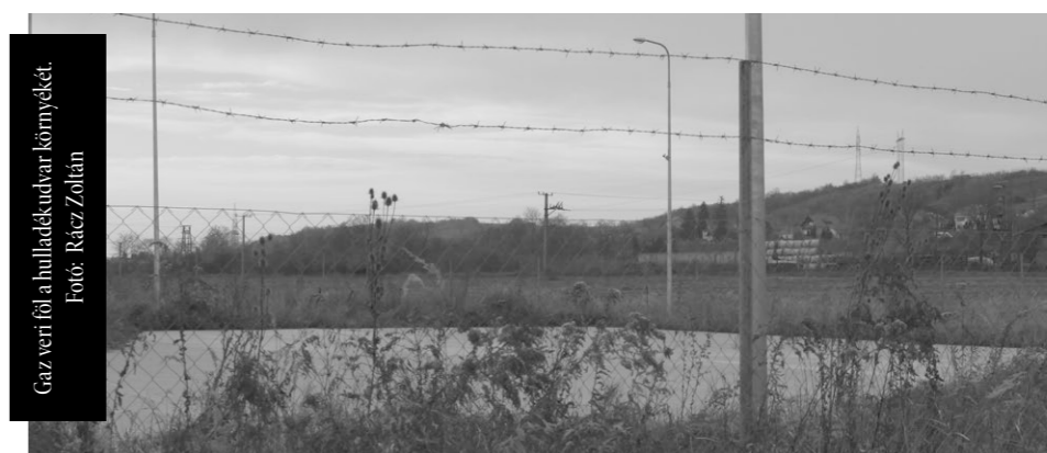
Caz veri föl a hulladékudvar környékét.

Az udvarok csak a háztartásokban képződő hulladékok befogadására szolgálnak. Ide lennének elhelyezhetők a papír-, műanyag-, üveg-, fém és zöldhulladékok, építési törmelék, gumiabroncsok, bútorok, egyéb lomok, elektromos háztartási készülékek, hűtők, lejárt