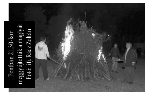
Ponban 21.30-kor meggyújtották a máglyát