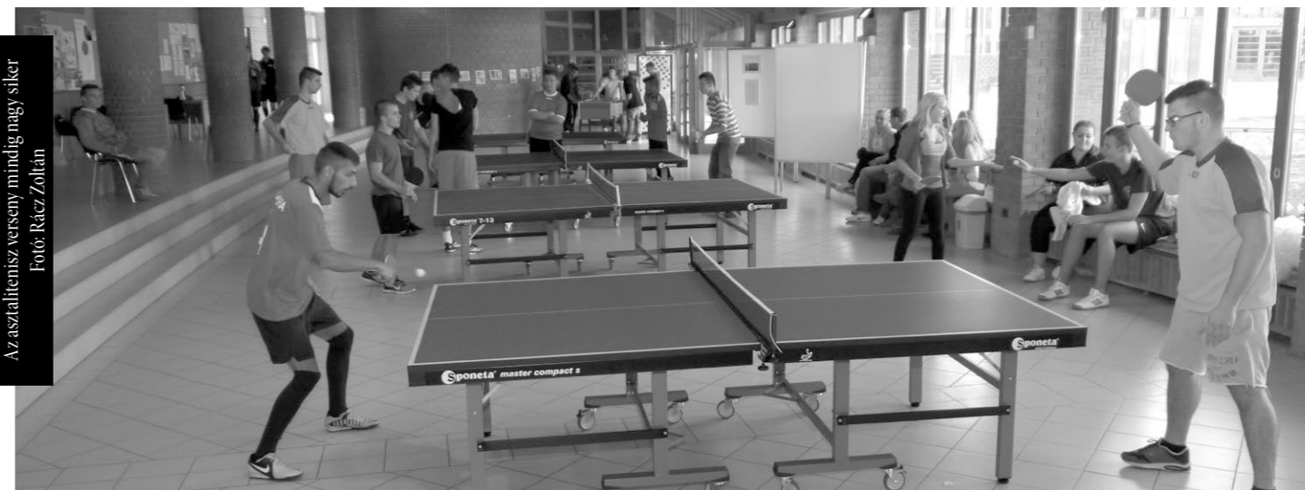
Aszaltitenisz verseny mindig nagy siker

Negyedik alkalommal rendezték meg az Evangélikus Egyház Aszódi Petőfi Gimnáziumában és Kollégiumában az Északi Egyházkerületi Sportnapot. Két napon keresztül versengtek az egyházkerülethez tartozó gyülekezetek csapatai, illetve egyéni indulói. Több, mint kétszázan élvezték a sport adta derűs vagy éppen nehéz pillanatokat.