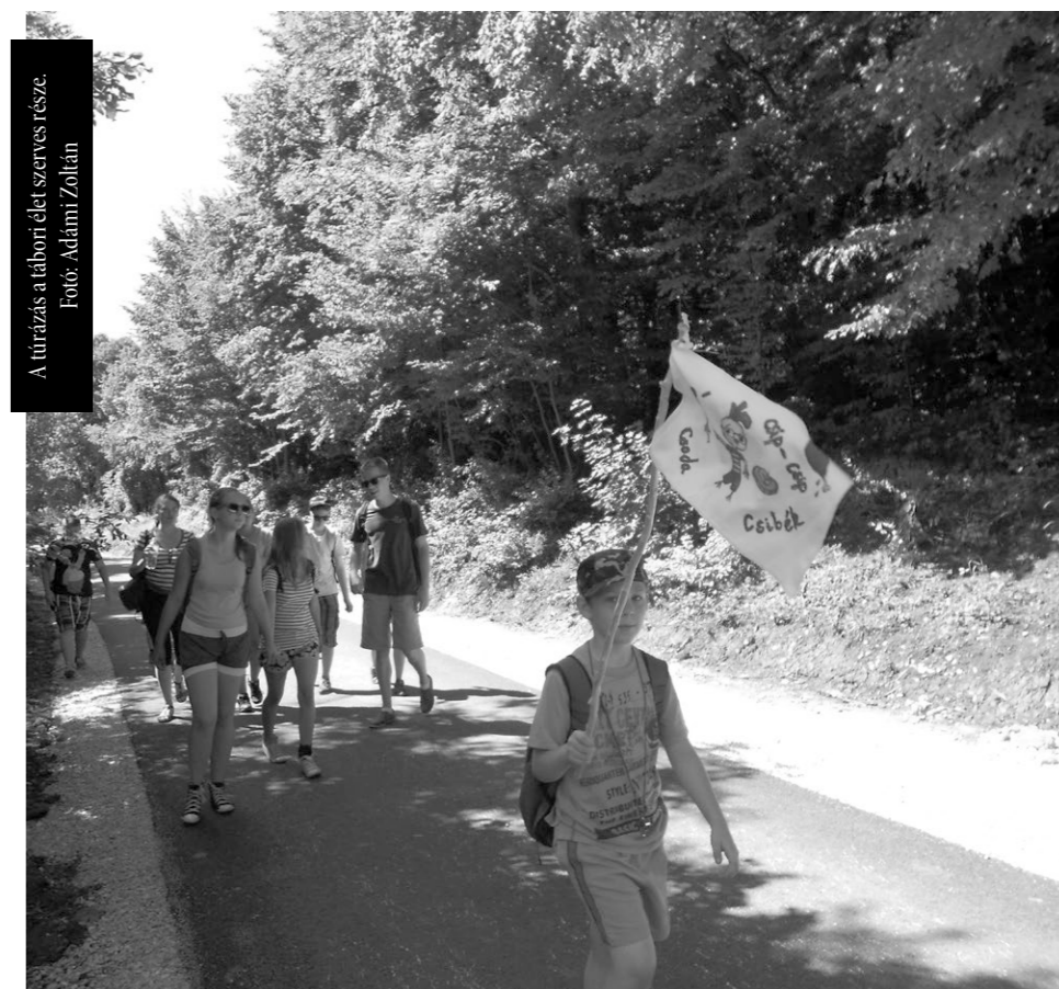
A túrázás a tábori élet szerves része