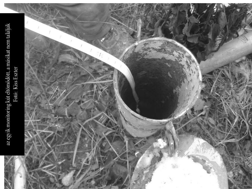
az egyik monitoring kút eltömődött, a másikat nem találják