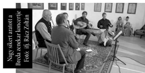
Nagy sikert aratott a Breda zenekar koncertje