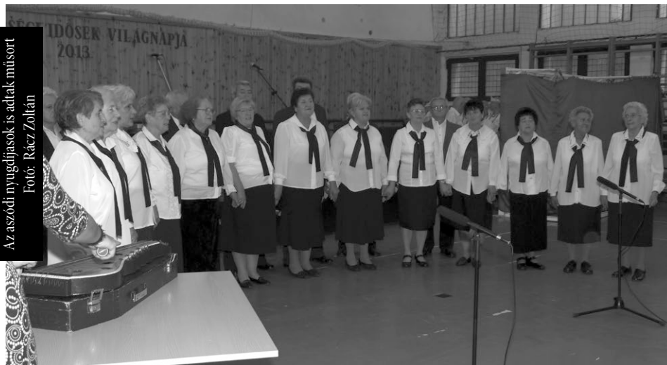
Az aszódi nyugdíjasok is adtak műsort

Félezernél is több nyugdíjas ünnepelt Aszódon